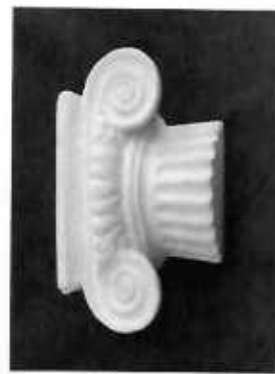
2-ші шығармашылық емтихан – «Сызу» (Берілген екі кескініне сәйкес үшінші көрінісін салу керек)